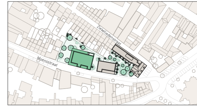
Situering 0 10 20 50 100 m